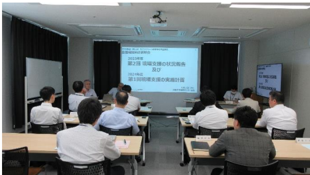
<第2回基礎講座の参加実績>